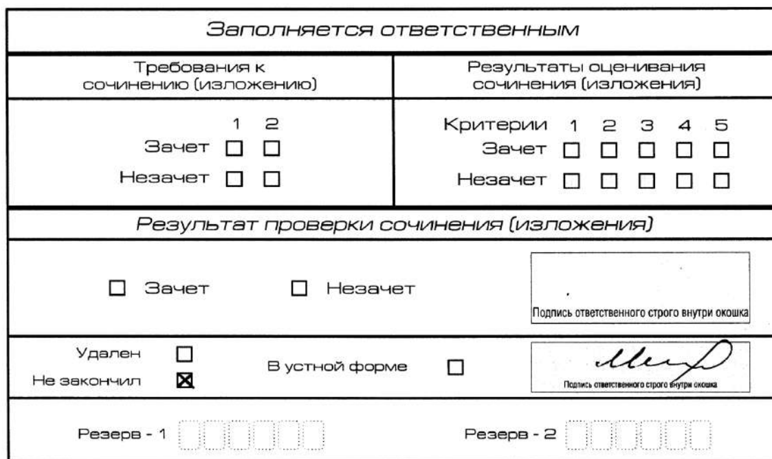
Рис. 12. Заполнение полей нижней части бланка регистрации (завершение написания сочинения (изложения) по уважительным причинам)

о досрочном завершении написания итогового сочинения (изложения) по уважительным причинам» (форма ИС-08), вносят соответствующую отметку в форму ИС-05 «Ведомость проведения итогового сочинения (изложения) в учебном кабинете ОО (месте проведения)» (участник итогового сочинения (изложения) должен поставить свою подпись в указанной форме). В бланке регистрации указанного участника итогового сочинения (изложения) необходимо внести отметку «Х» в поле «Не закончил» для учета при организации проверки, а также для последующего допуска указанных участников к повторной сдаче итогового сочинения (изложения) в дополнительные сроки. Внесение отметки в поле «Не закончил» подтверждается подписью члена комиссии по проведению итогового сочинения (изложения) (см. рис. 12).